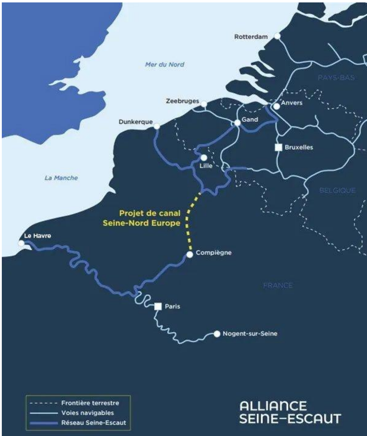
Carte : la liaison européenne Seine-Escaut 3